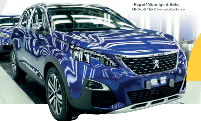
◀ Peugeot 3008 sur ligne de finition, site de Sochaux