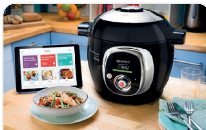
↑ Foodle votre application de recommandation de recettes