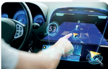
↑ Système de navigation sur un tableau de bord de voiture