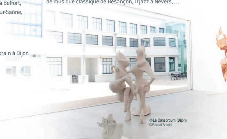
↑ Le Consortium (Dijon)