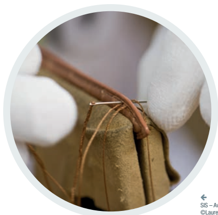
← SIS - Avoudrey

*Horlogerie-Bijouterie-Joaillerie-Orfèvrerie