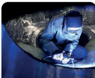
↑ Framatome, soudage sur un générateur de vapeur EPRT