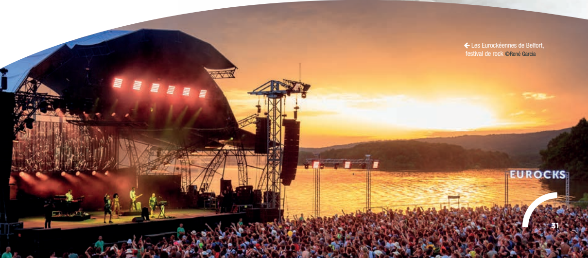
← Les Eurockéennes de Belfort, festival de rock