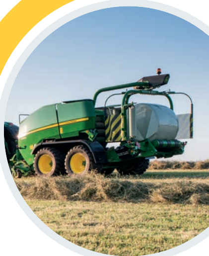
↑ Engin agricole fabriqué dans l'usine John Deere d'Arc-les-Gray