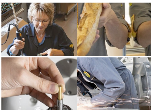
Conférence économique régionale 5 avril 2023 – DIJON

Le développement économique fait partie de politiques majeures de la Région. En 2023, elle consacrera 72,2 M€ à sa politique en faveur du développement économique, de l'emploi et de l'économie sociale et solidaire. Son rôle d'orientation de l'action publique économique est conféré par la loi depuis 2015.