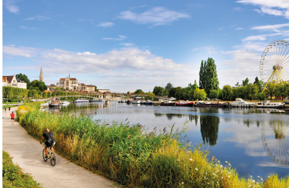
Quai de l'Yonne

La ville dispose également d'un centre de congrès et d'un parc d'exposition, Auxerreexpo , où vous pourrez profiter de nombreuses foires, salons ainsi que des soirées à thème. Auxerre c'est également cinq musées dont trois musées de France. Parmi eux, le musée d'art et d'histoire , installé au cœur des bâtiments monastiques de l'Abbaye Saint-Germain. Vous y découvrirez les secrets