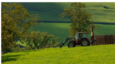
Paysage du Charolais