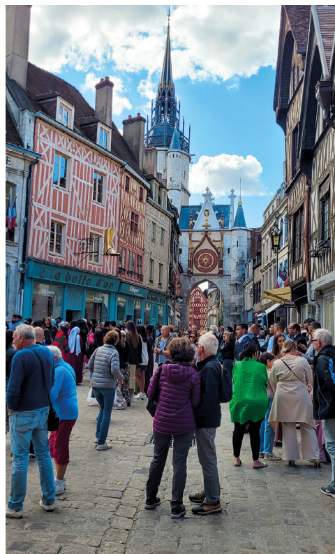
Tour de l'horloge

Le centre-ville d'Auxerre propose de nombreux commerces de proximité , allant de l'équipement de la personne, à des bars et restaurants... Les rues du Temple, d'Egleny, du Pont ou Joubert, au cœur de la ville-préfecture, proposent ainsi une offre commerciale équilibrée et adaptée à toutes les bourses. Le programme Action Cœur de Ville va également permettre d'embellir le centre d'Auxerre et attirer de nouveaux commerçants. En parallèle, le centre commercial des Clairions, situé à peine à un kilomètre du centre d'Auxerre, propose une cinquantaine de boutiques et magasins de grandes enseignes, dont un hypermarché.