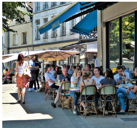
Terrasse Mama Julia