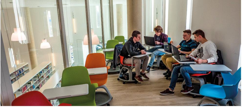
Formation 3

Dans le cadre de l'expansion des filières diplômantes, la Communauté de l'Auxerrois collabore avec l'Isat ( Institut Supérieur de l'Automobile et des Transports ) à Nevers pour l'établissement d'une antenne spécialisée dans la motorisation hydrogène.