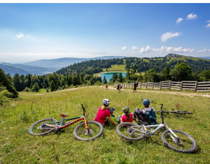
Métabief, Montagnes du Jura/Syndicat Mixte du Mont d'Or