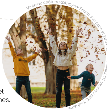
Visite du château d'Ancy-le-Franc, son parc et jardin Ludovic CAILLOT Invision / BFC Tourisme