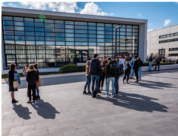
Formation I © Communauté de l'Auxerrois

L'agglomération auxerroise offre une diversité étendue de formations, couvrant un spectre allant du Certificat d'Aptitude Professionnelle (CAP) au Master, dans tous les secteurs d'activité. Ces programmes éducatifs sont dispensés par divers organismes, certains spécialisés dans la formation pour adultes, d'autres axés sur les études supérieures (post-bac) ou l'apprentissage. Il est à noter qu'Auxerre se positionne en tant que premier pôle de formation par alternance en Bourgogne .