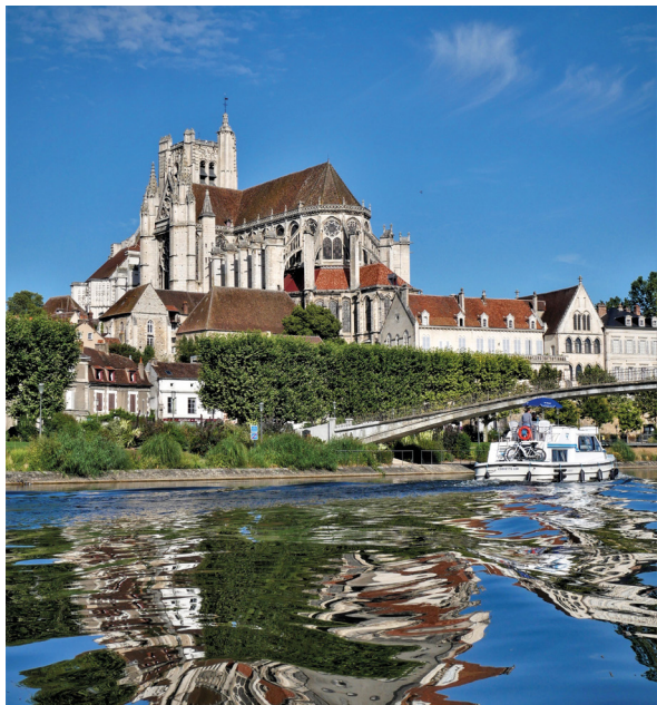
Abbaye Saint-Germain

Les amateurs de nature seront comblés par la diversité des paysages, entre champs, forêts, canaux et vignes , offrant une multitude de circuits pour la marche, la course à pied ou le cyclisme. La ville et son agglomération disposent également d'infrastructures dédiées au spectacle vivant : Le Silex , labellisé Scène de Musiques Actuelles. Depuis 2010, la salle accueille une programmation moderne et éclectique à l'image d'Hoshi, Hervé, La Grande Sophie ou encore Déportivo, tous passés ici. Autre scène conventionnée, le Théâtre d'Auxerre propose quant à lui des spectacles de danse contemporaine, théâtre, cirque et musique classique. Vous retrouverez en plus un cinéma et un conservatoire où l'on pratique la musique, la danse et le théâtre à un niveau départemental.