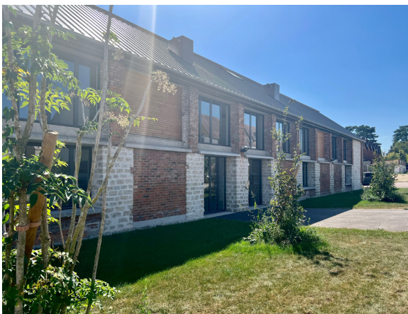
AuxR_Factory © Communauté de l'Auxerrois