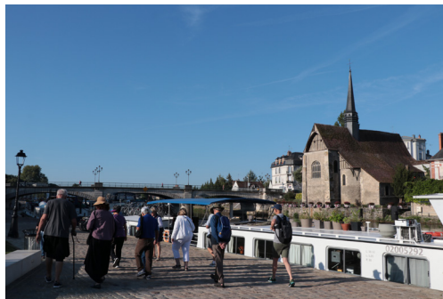
Quais de Sens en été