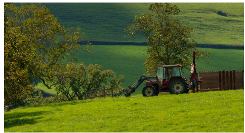
Paysage du Charolais