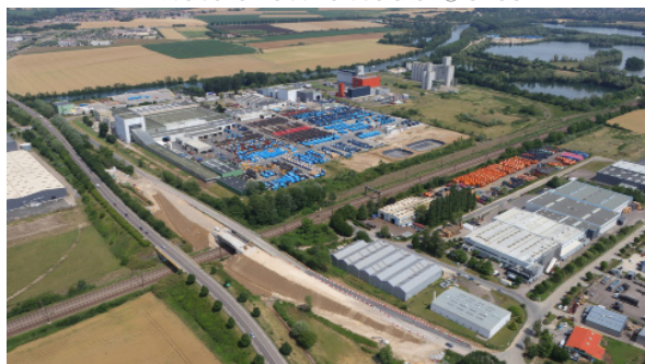
Vue aérienne du Port de Cron