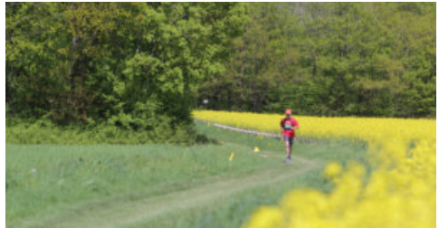
Trail du Grand Sénonais

Avec ses nombreux équipements et son large éventail d'associations sportives, Sens « Ville Active & Sportive » aux 4 lauriers et le Sénonais offrent aux sportifs du quotidien (comme du dimanche) un large choix d'activités et de sensations ! Du football au karting en passant par le rugby, le volley, l'escalade, la voile ou la course d'orientation, il y en a pour tous les goûts ! Cet esprit sportif du Sénonais se traduit aussi par ses événements à rayonnement national voir international : Trail du Grand Sénonais, Tournoi sans Frontières, Rallye du Grand Sénonais... sans oublier le 11 juillet 2024 : le passage de la flamme olympique à Sens !