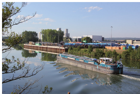
Port de Cron

Le Grand Sénonais dispose d'un des principaux ports industriels et économiques de la région, le port de Cron, offrant une véritable plateforme multimodale aux acteurs économiques et garantissant un accès par voie fluviale aux ports de la région parisienne et du Havre.