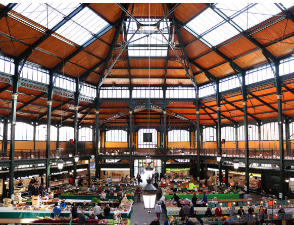
Intérieur marché couvert de Sens

Le Grand Sénonais, avec ses 1 400 commerçants et artisans, offre à chacun la possibilité de consommer localement et durablement sur l'ensemble des 27 communes composant l'Agglomération ; Le territoire est également fort de ses marchés.