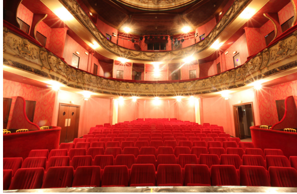
Théâtre de Sens

Envie de franchir les portes du théâtre à l'italienne de Sens ou de l'Espace Pincemin de Villeneuve-sur-Yonne ? De découvrir les talents - petits et grands - du Conservatoire du Grand Sénonais (musique, danse, théâtre) ? Le sénonais par sa richesse et sa diversité culturelle, saura vous séduire !