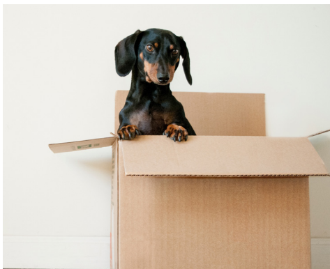
Cartons de déménagement

* En moyenne (source : données climat 2021)