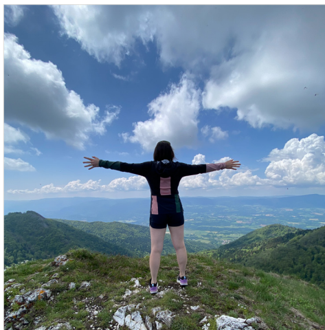
Randonnée sur les Crêtes du Grand Colombier