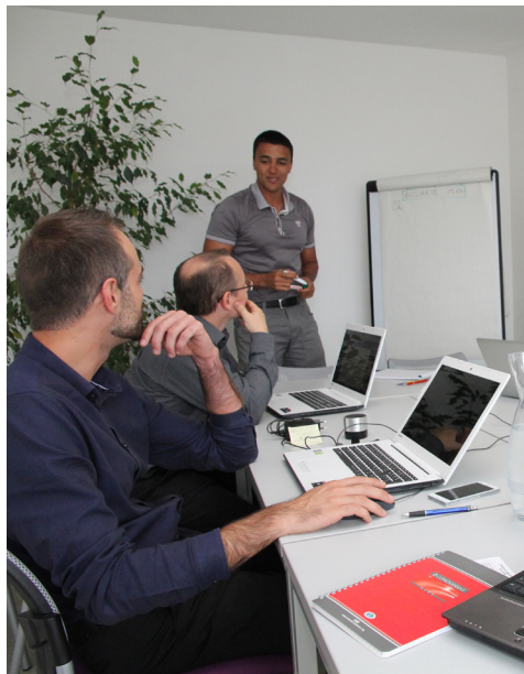
Espace de coworking