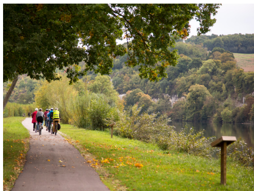
La voie verte de Sens