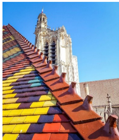
La Cathédrale Saint-Etienne