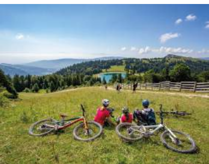
Métabief, Montagnes du Jura/Syndicat Mixte du Mont d'Or