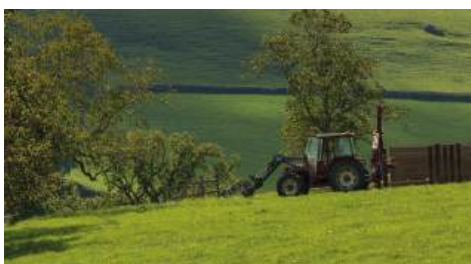
Paysage du Charolais